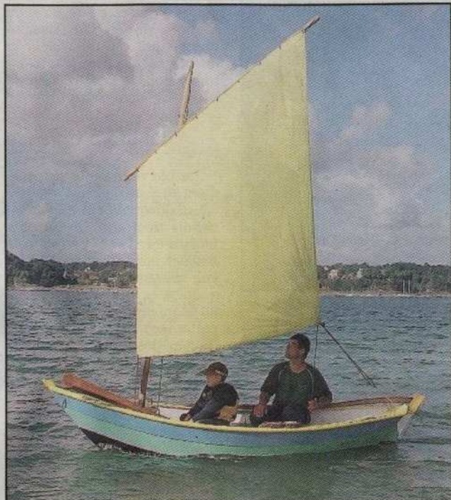
Les doris, une histoire de famille