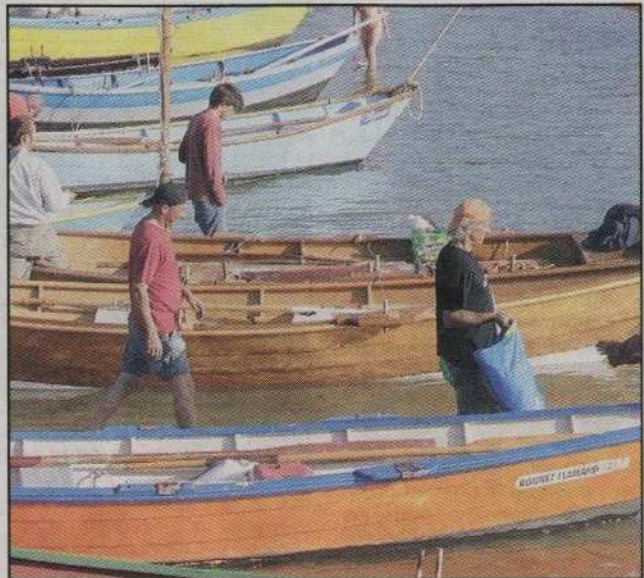
La fête a su rester authentique.