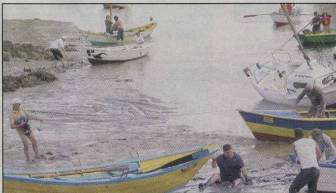
Les marées ont joué des tours aux vieux loups de mer, et la vase est glissante...