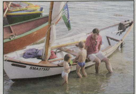
Des familles entières paticipent à la fête.